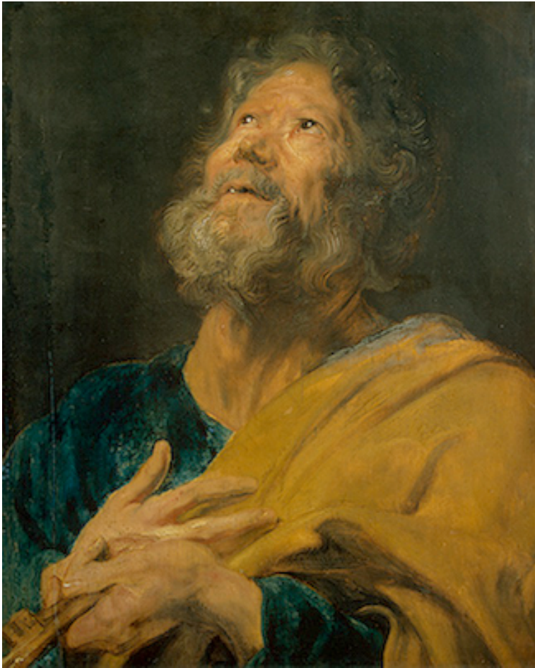
St Pierre repentant Antoine Van DUYCK 1617-1618 Musée de l'Ermitage St Petersbourg

=> 30 minutes pour méditer un tableau (au choix) : c'est la préparation communautaire du sacrement de réconciliation: